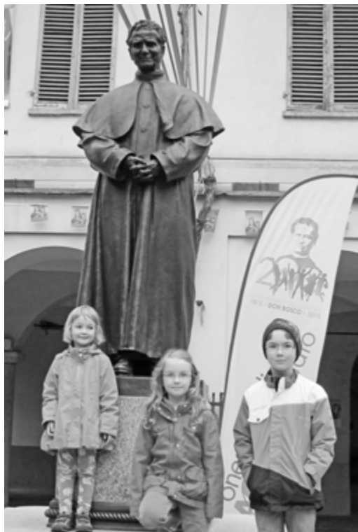
Ob don Bosku - Valdocco v Turinu.

kmečkega življenja, ki nazorno pokaže kako so živeli v tistih časih in kako je bila opremljena hiša, Etnološki misijonski muzej, ki izraža mednarodnost salezijanske družbe, ter kapelico sanj, ki jih je imel don Bosko pri devetih letih. V baziliki smo se udeležili maše, katero je vodil italijanski salezijanski kardinal s sobrati, ki so ta dan tudi priromali na Colle don Bosko. Pod baziliko smo si ogledali relikvije svetega Janeza Boska.