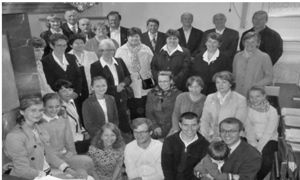
Pevci in inštrumentalisti za birmo 2015